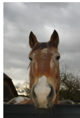
Tokahe (Der Eigenwillige)