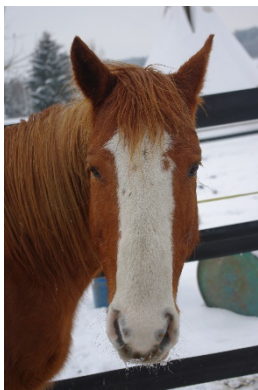
Gold Boy (Der ungeduldige)