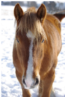
Florina (Die Zartbesaitete)