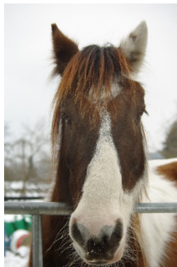
Milan (Eben ein Vogel)